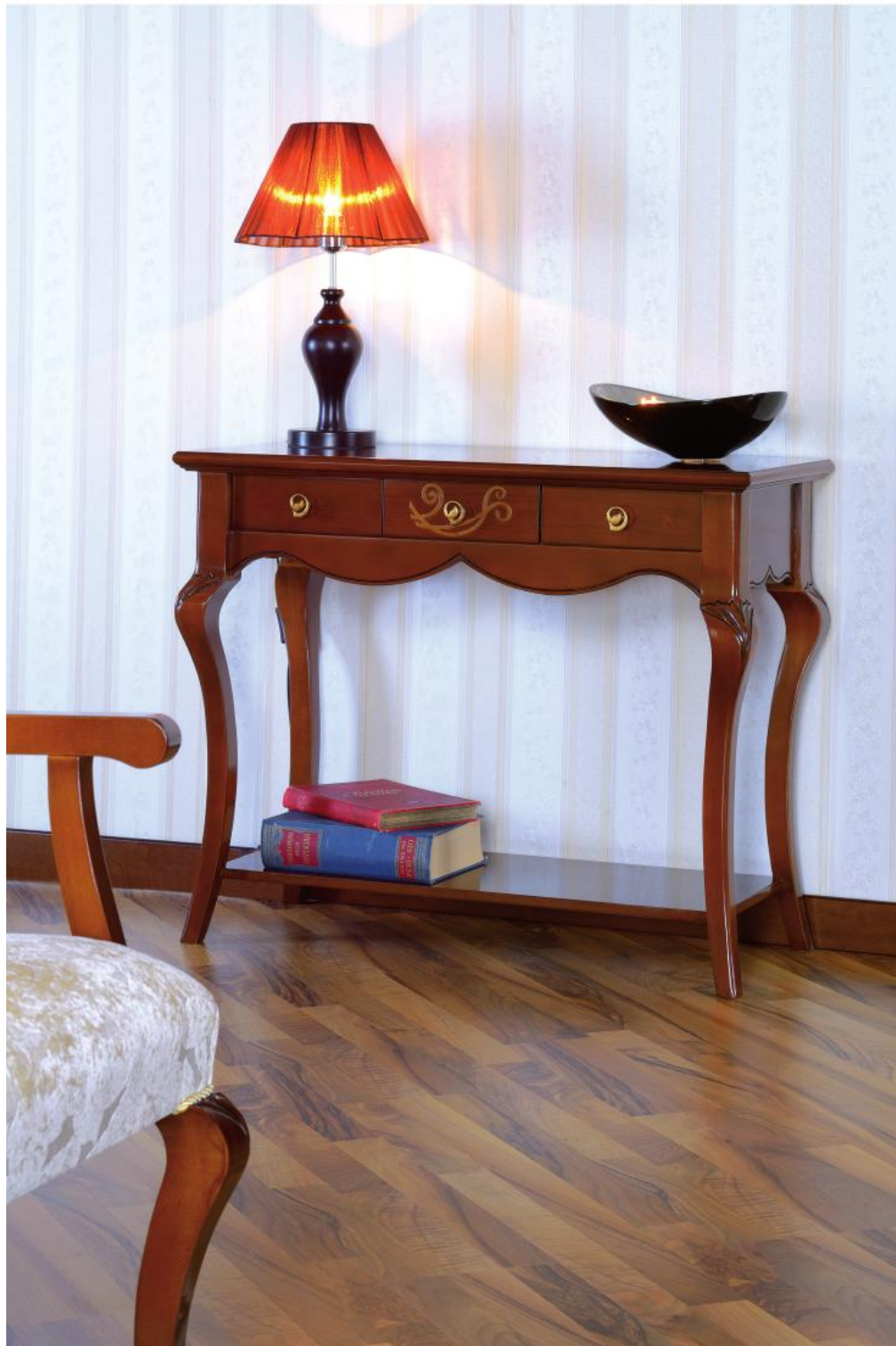
3 drawers console Consolă 3 sertare Консоль 3 ящ. mm 923 423 750 h