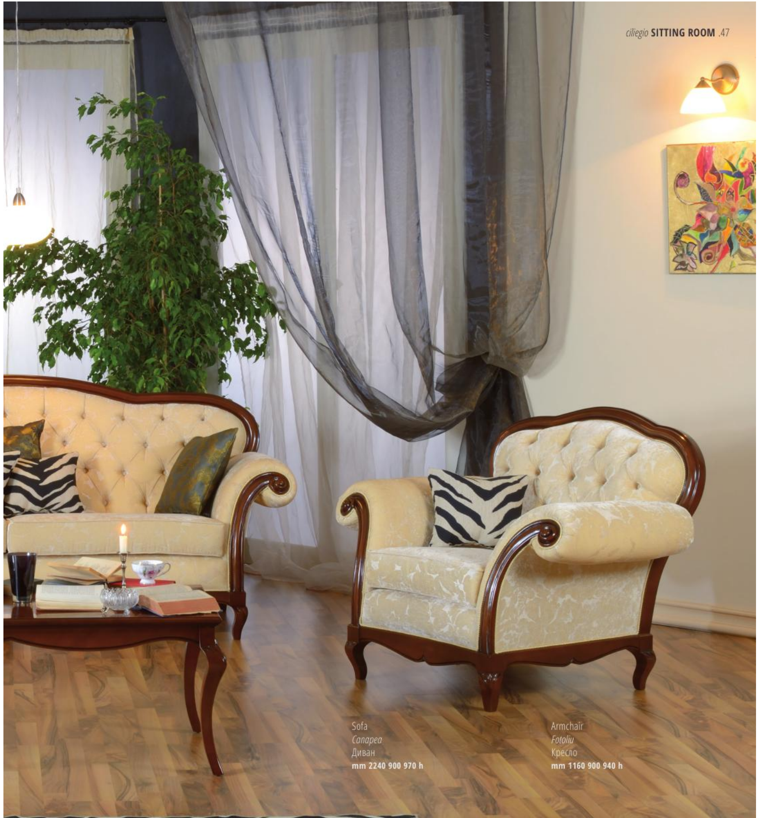
Sofa Сопареа Диван mm 2240 900 970 h