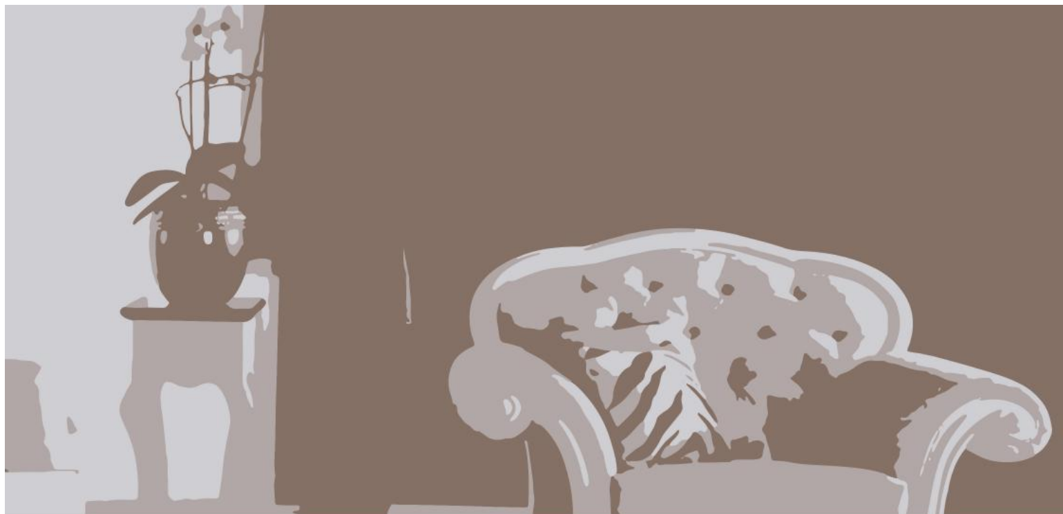
Sitting room Hol Холл