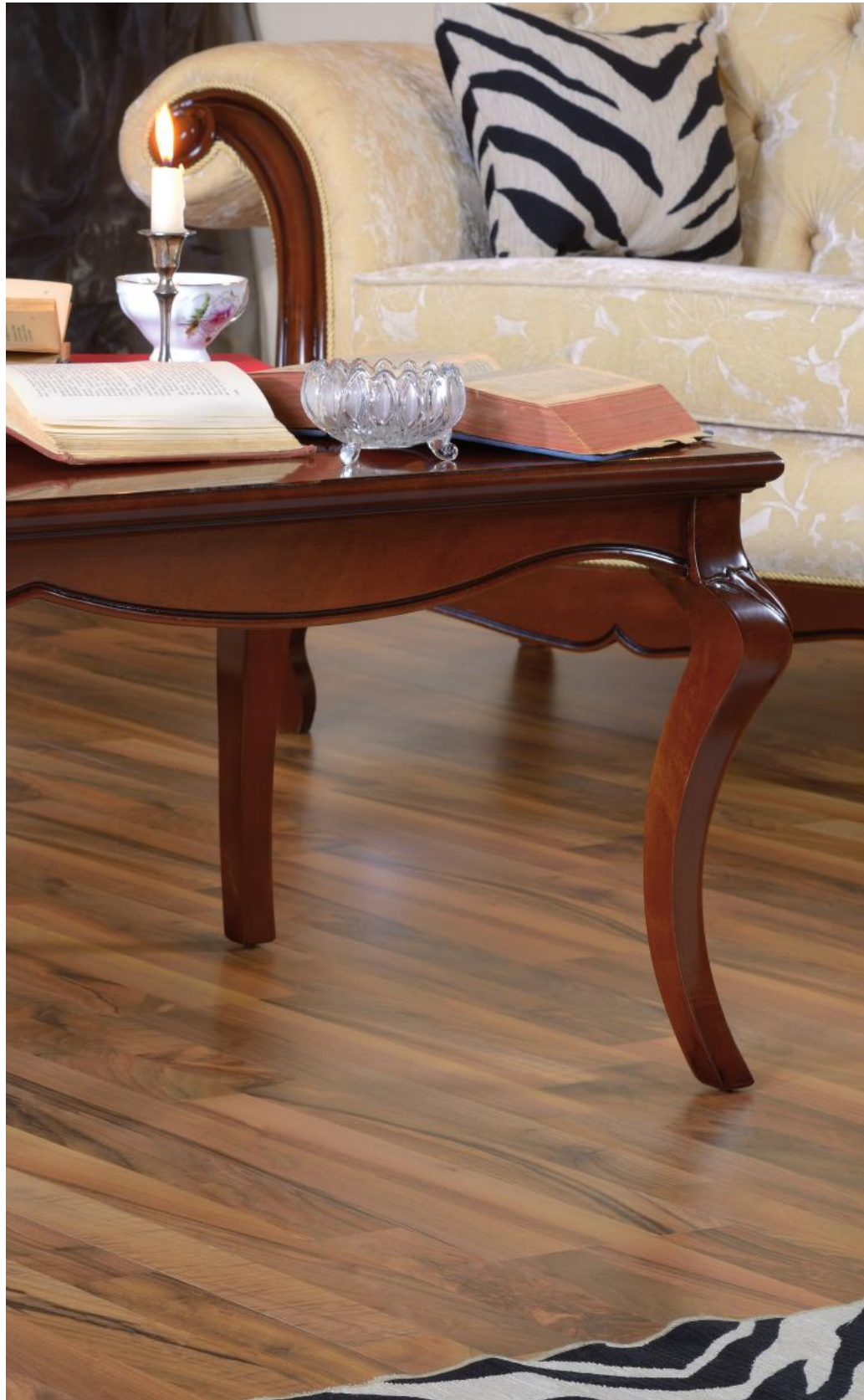
Rectangular table 1200 Masař 1200 Журнальный столик прям. 1200 mm 1212 612 450 h