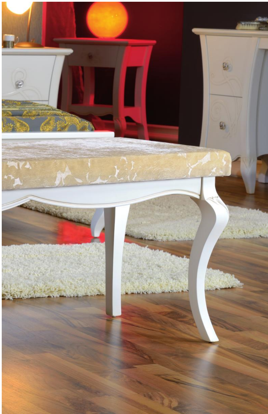
Hocker Banchetä Банкетка обитая 120 mm 1211 431 480 h