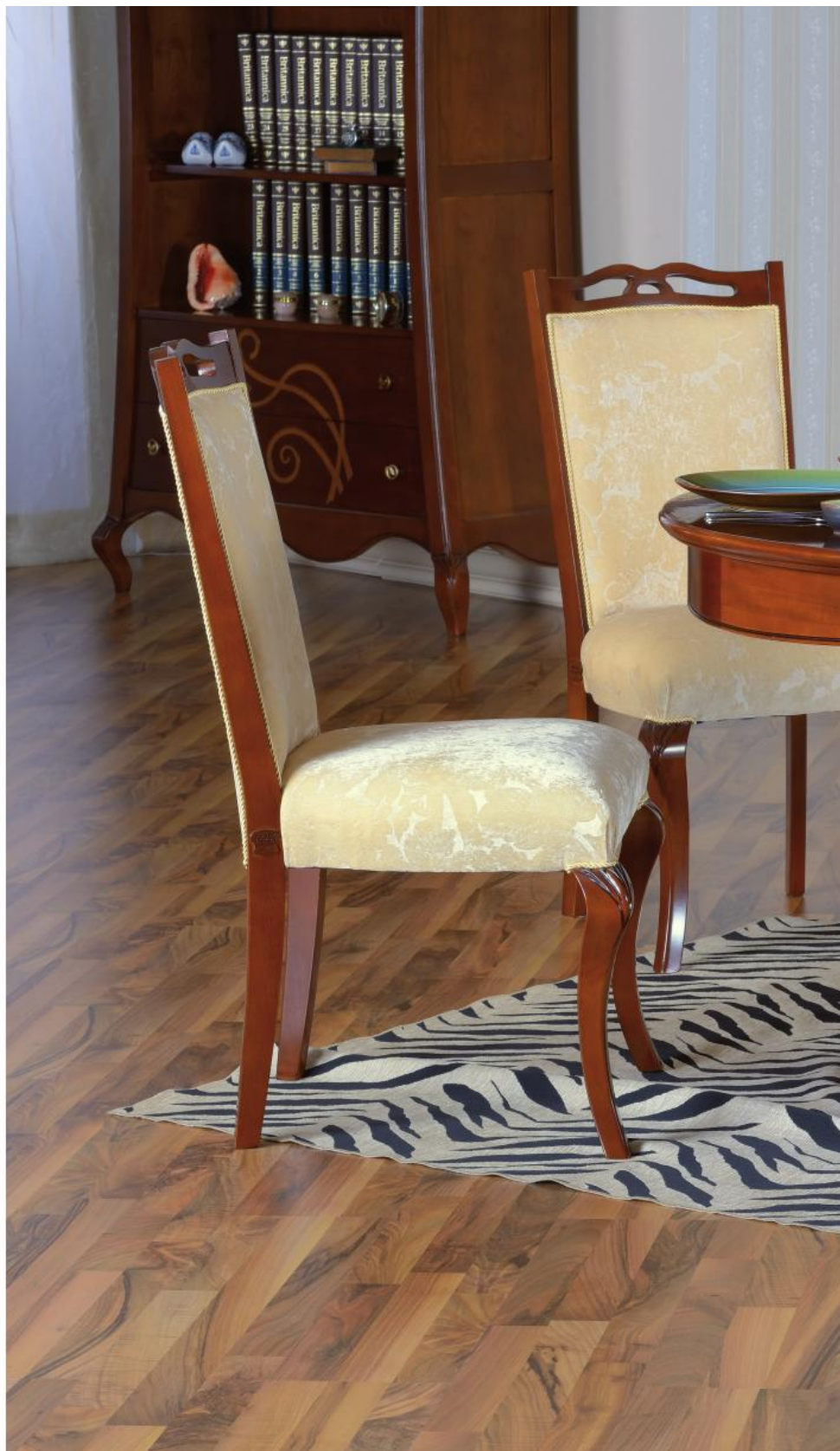
Round extending table Masă rotundă extensibilă Стол круглый раскл. mm \phi 1200/1630 750 h