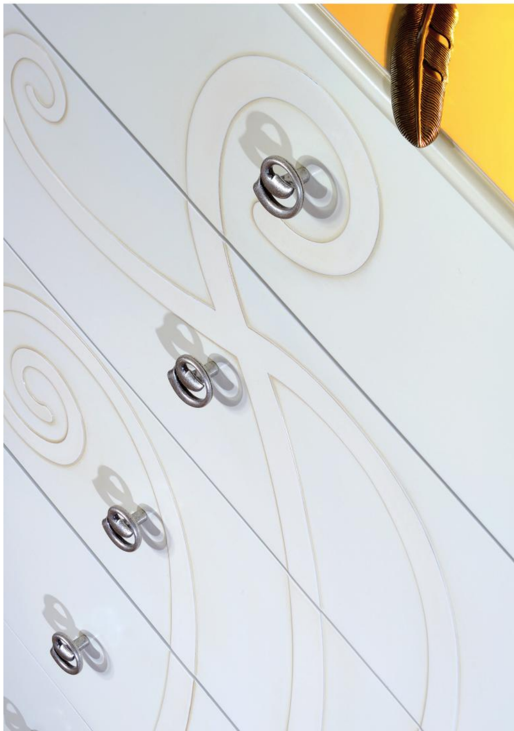
5 drawers chest Comodă 5 sertare Комод 5 ящ. mm 800 465 1079 h