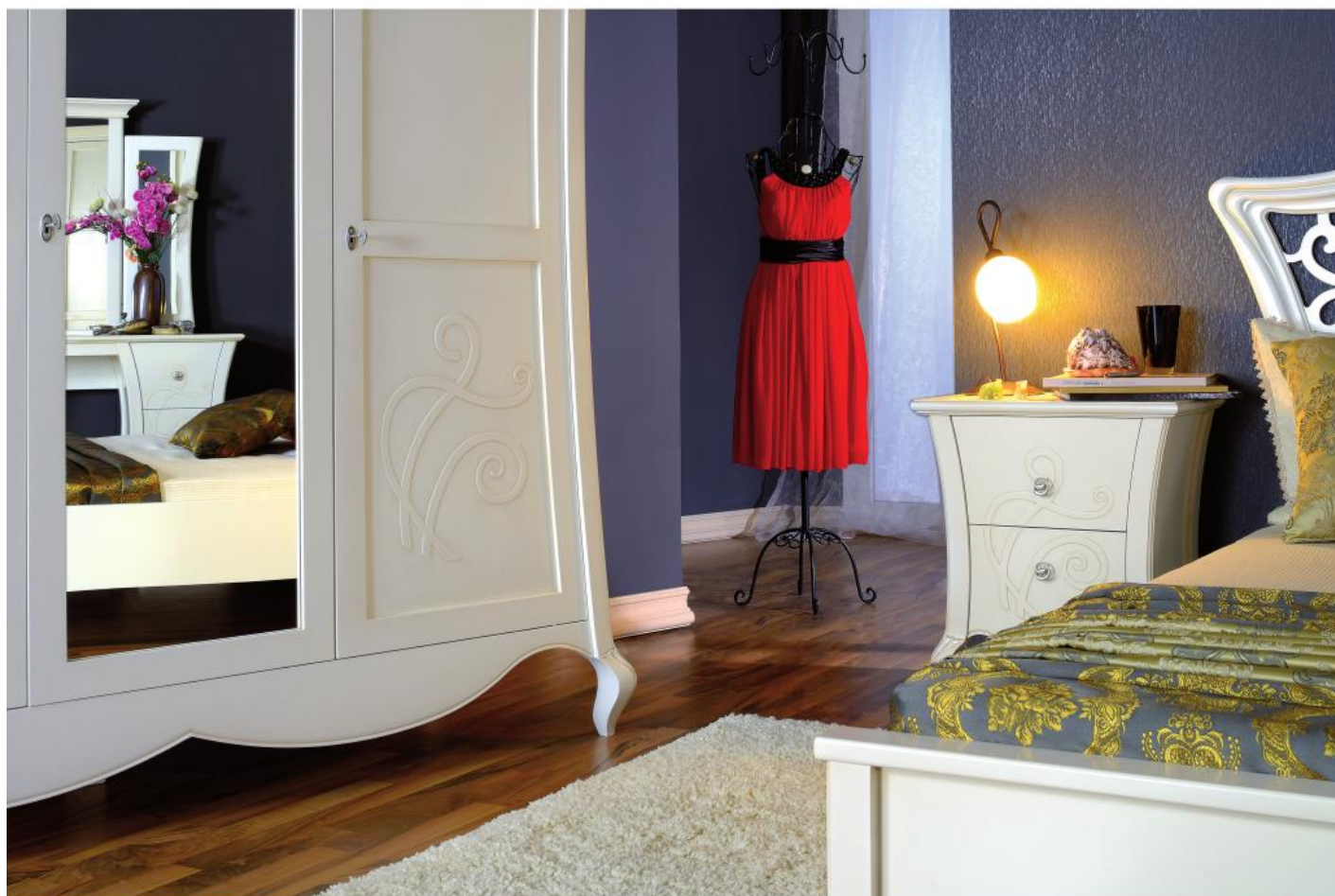
3 doors wardrobe (mirror) Dulap 3 uși cu oglindă Шкаф 3-х дв. с зеркалом mm 1890 685 2250 h