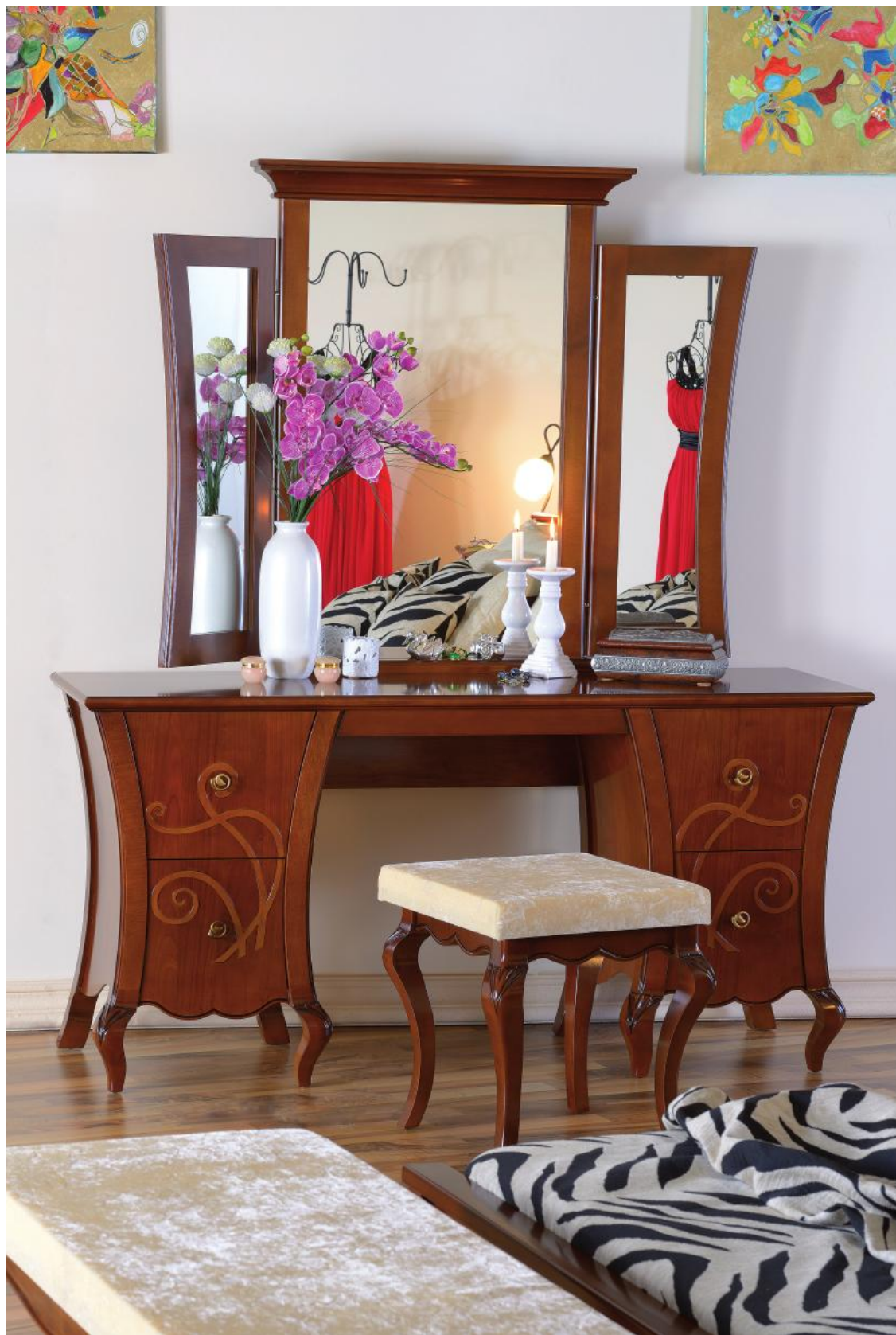
Mirror frame Ramă oglindă triptică Рама с зеркалом для туалетного столика mm 1310 79 1000 h