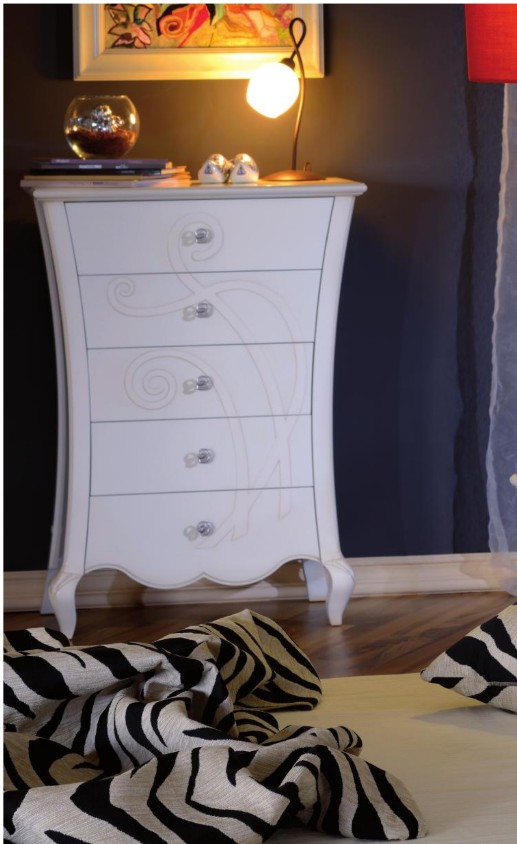
5 drawers chest Comodă 5 sertare Комод 5 ящ. mm 800 465 1079 h