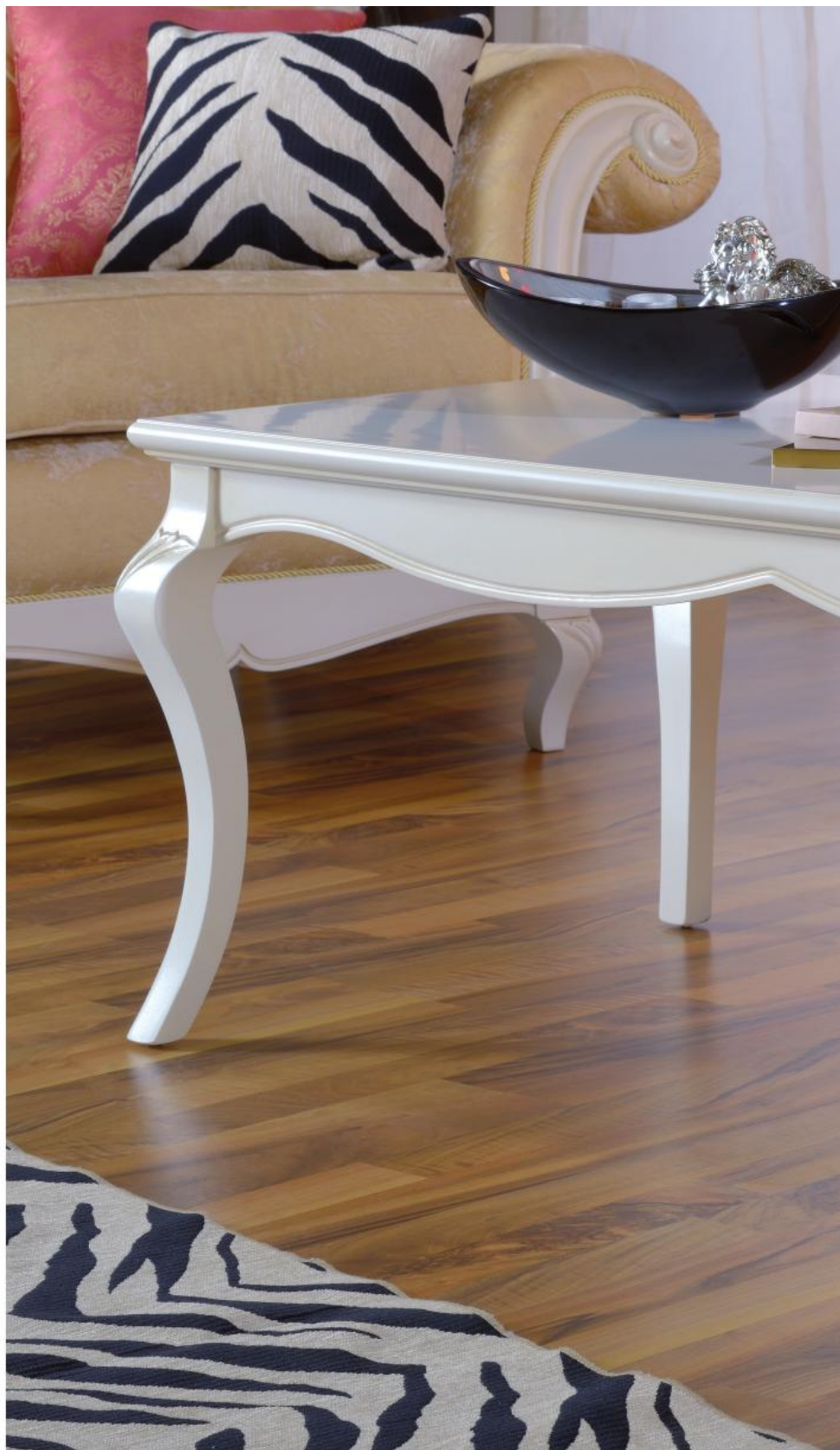
Rectangular table 1200 Mösuğā 1200 Журнальный столик прям. 1200 mm 1212 612 450 h