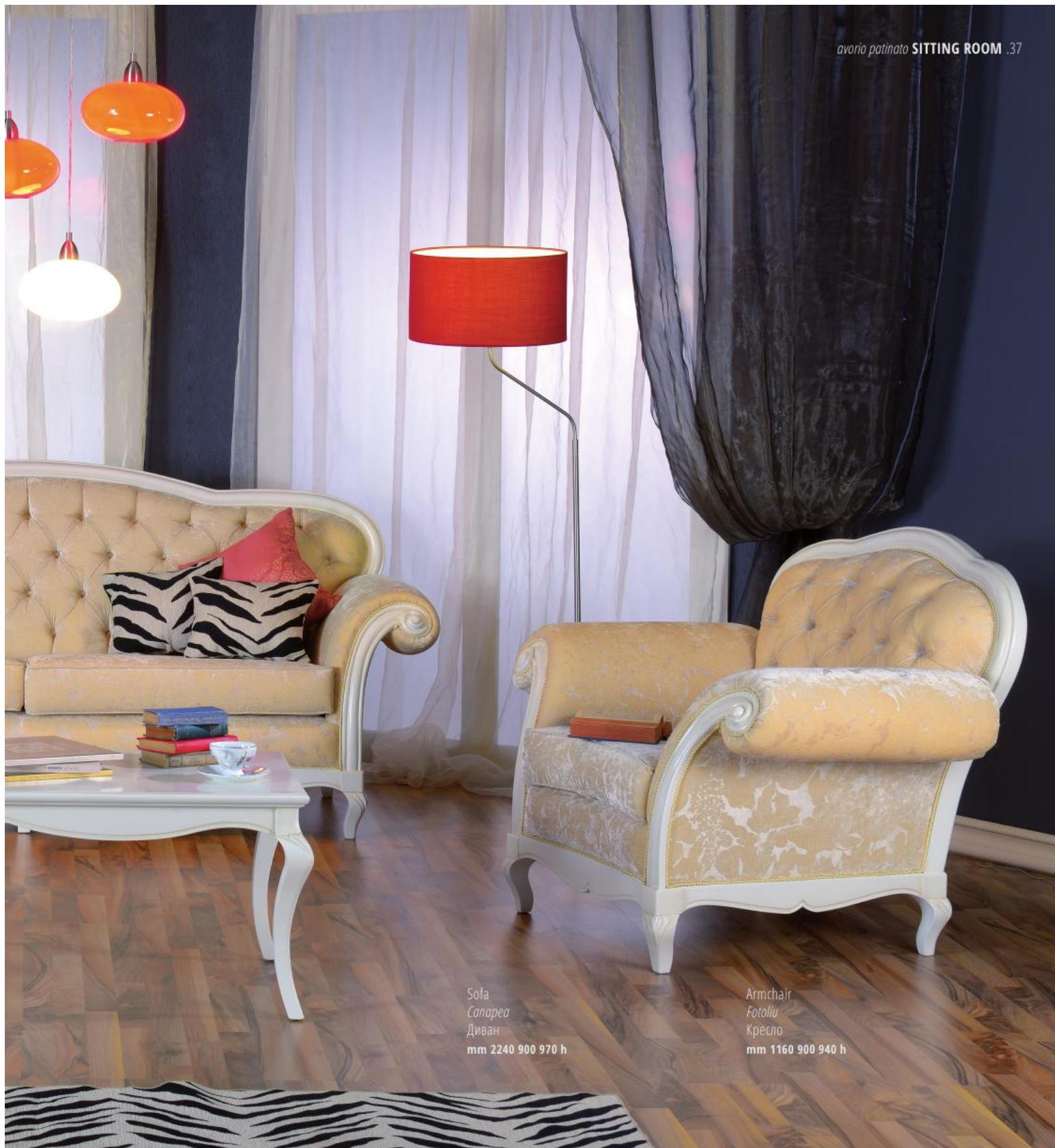
Sofa Сапарео Диван mm 2240 900 970 h