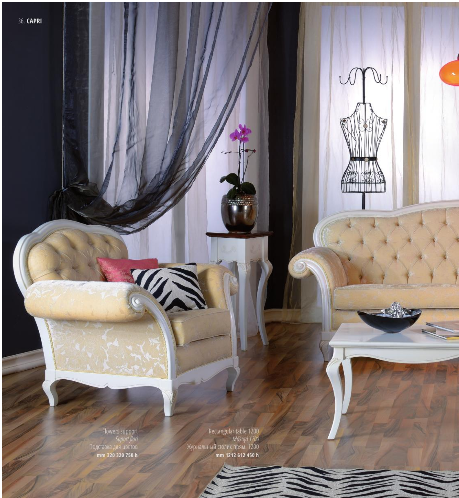
Flowers support Support flori Подставка для цветов mm 320 320 750 h