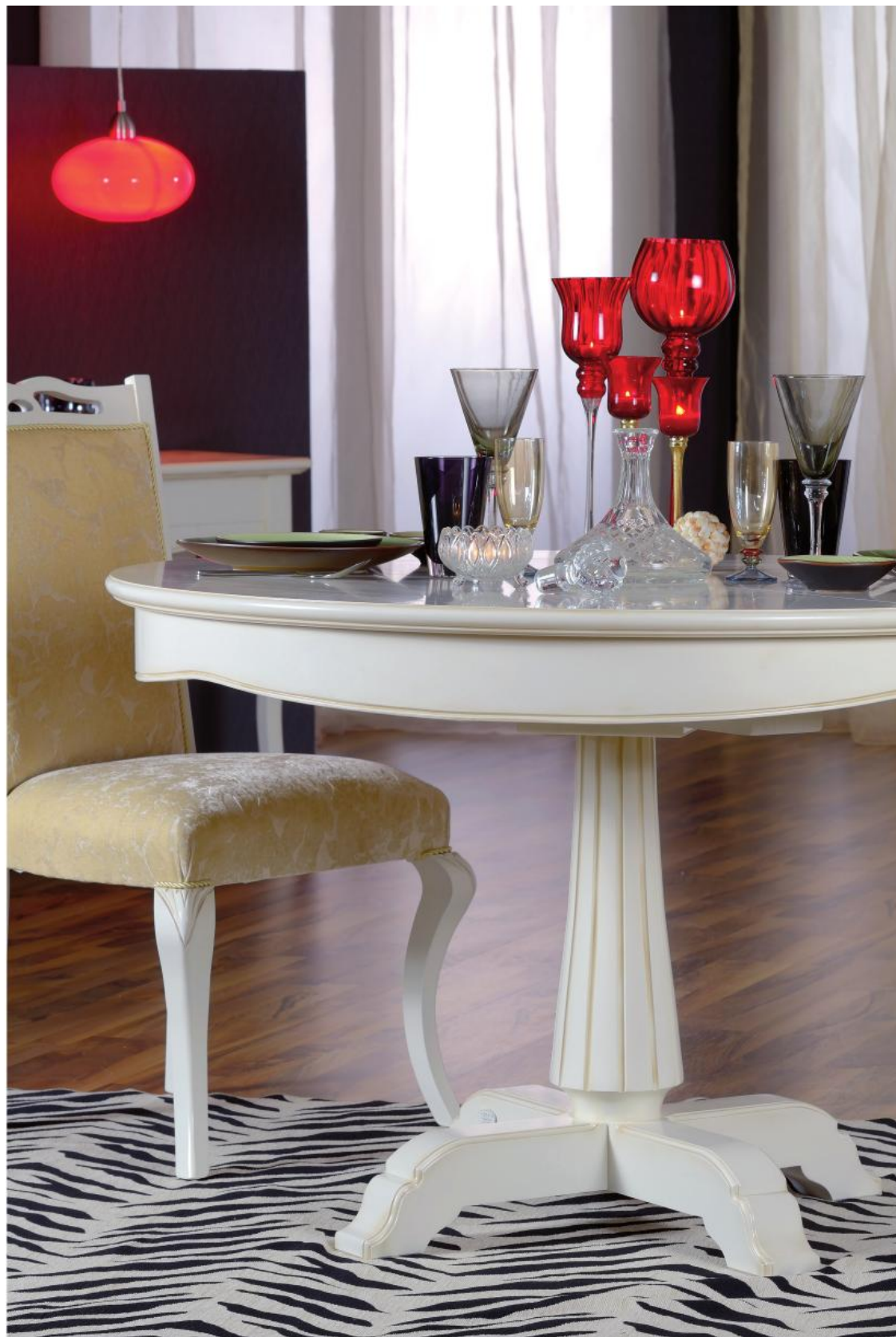
Round extending table Masă rotundă extensibilă Стол круглый раскл. mm \phi 1200/1630 750 h