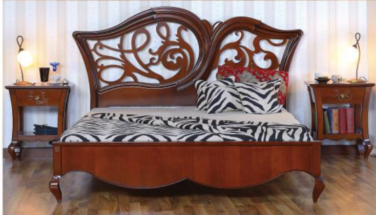
Bed 160/180 with fretted headboard Pat 160/180 cu tablă traforată Кровать 160/180 изголовье с резьбой mm 1962/2180 2120 1285 h