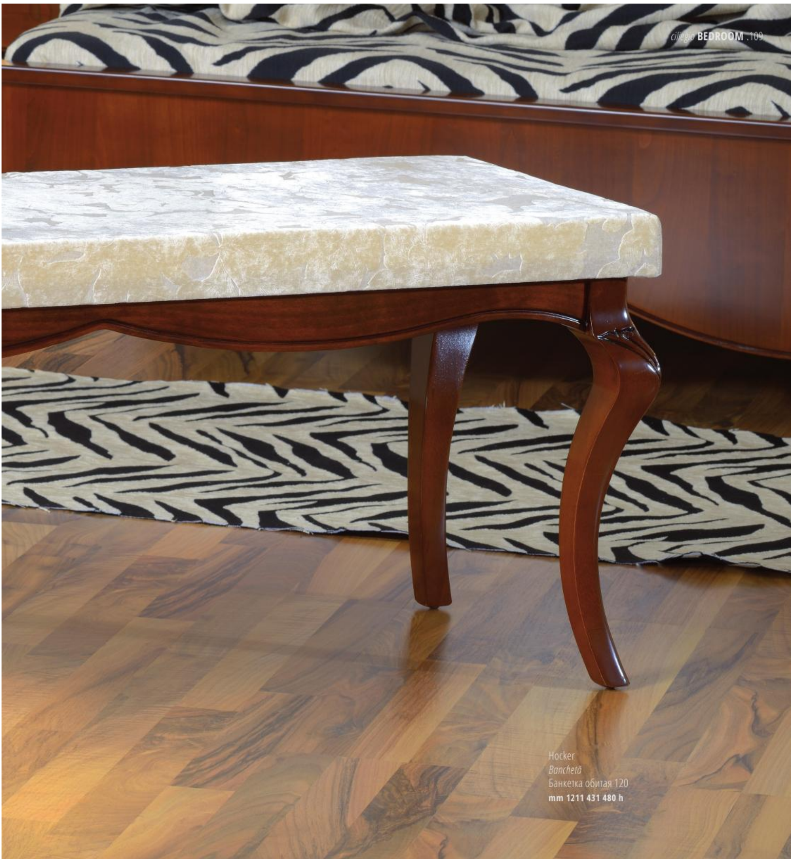
Ночер Vanisher Банкетка обитая 120 mm 1211 431 480 h