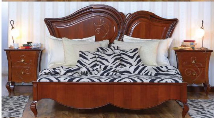
Bed 160/180 with patterned headboard Pat 160/180 tablă cu ornament Кровать 160/180 деревянное изголовье с аппликациями mm 1962/2180 2120 1285 h