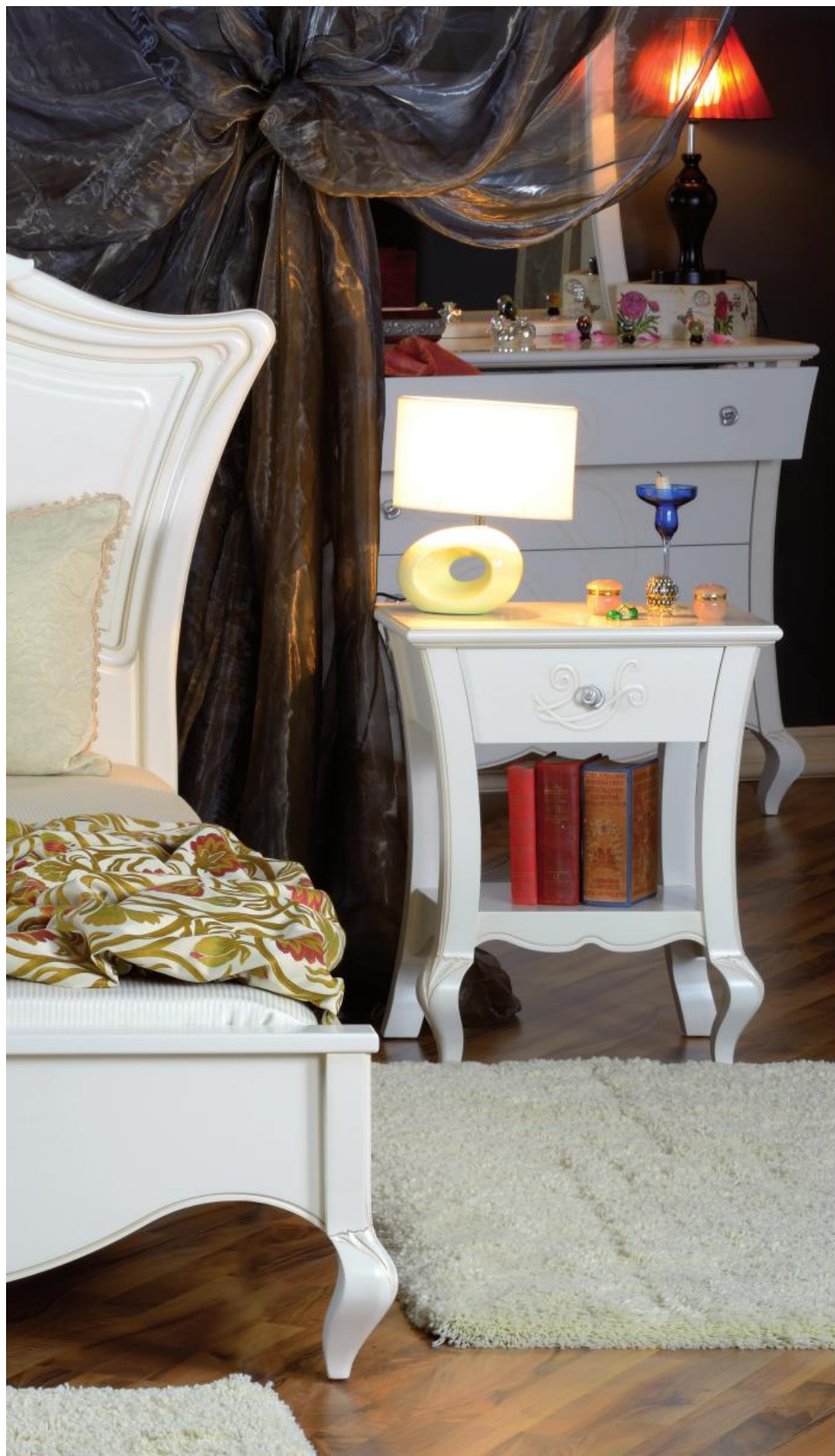
Bed 160/180 with patterned headboard Pat 160/180 tãblie cu ornament Кровать 160/180 деревянное изголовье с аппликациями mm 1962/2180 2120 1285 h