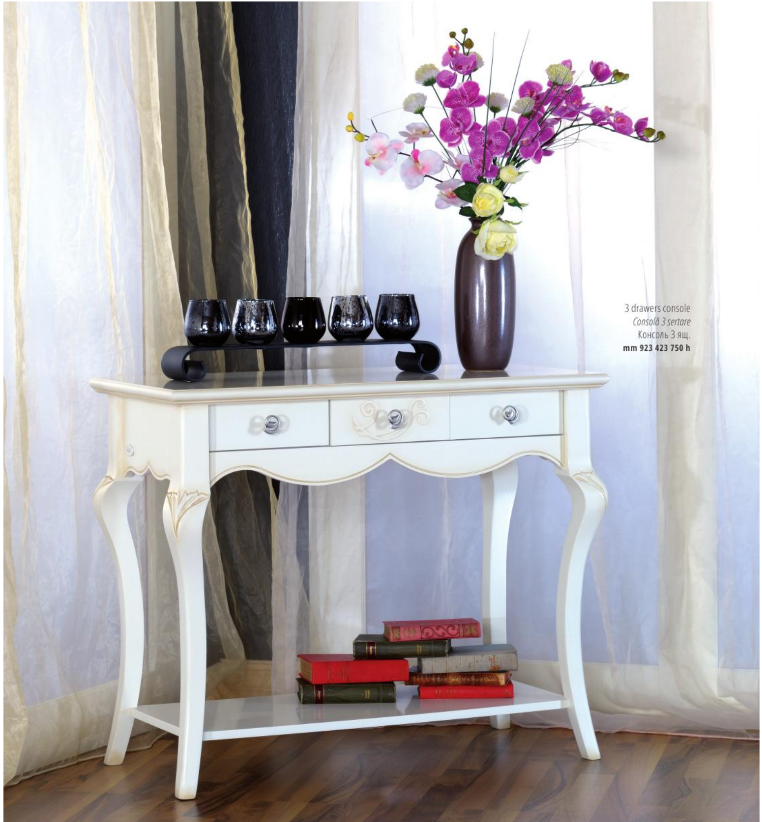
3 drawers console Consolă 3 sertare Консоль 3 ящ. mm 923 423 750 h