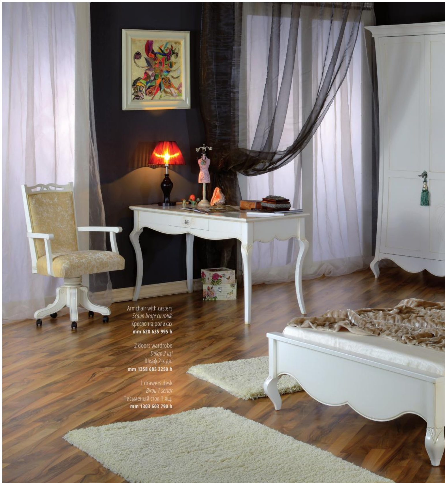
Armchair with casters Scaun braje cu rotile Кресло на роликах mm 628 635 995 h