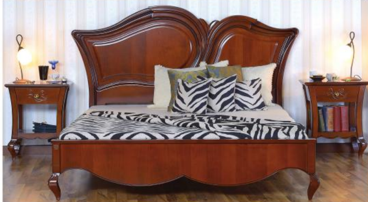
Bed 160/180 with plain headboard Pat 160/180 Кровать 160/180 деревянное изголовье mm 1962/2180 2120 1285 h