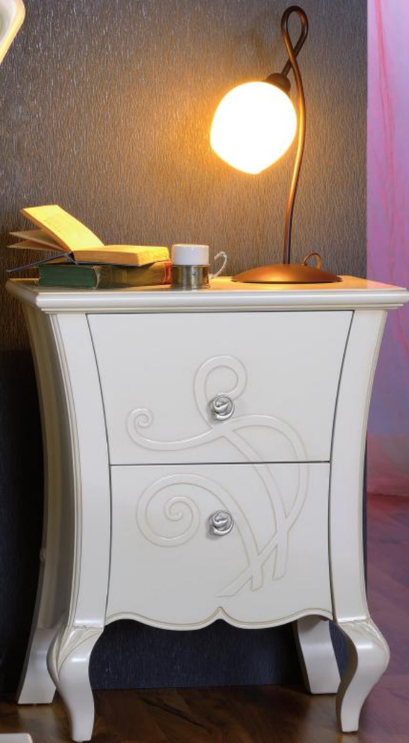
2 drawers bedside table Noptieră 2 sertare Тумбочка 2 ящ. mm 538 351 637 h