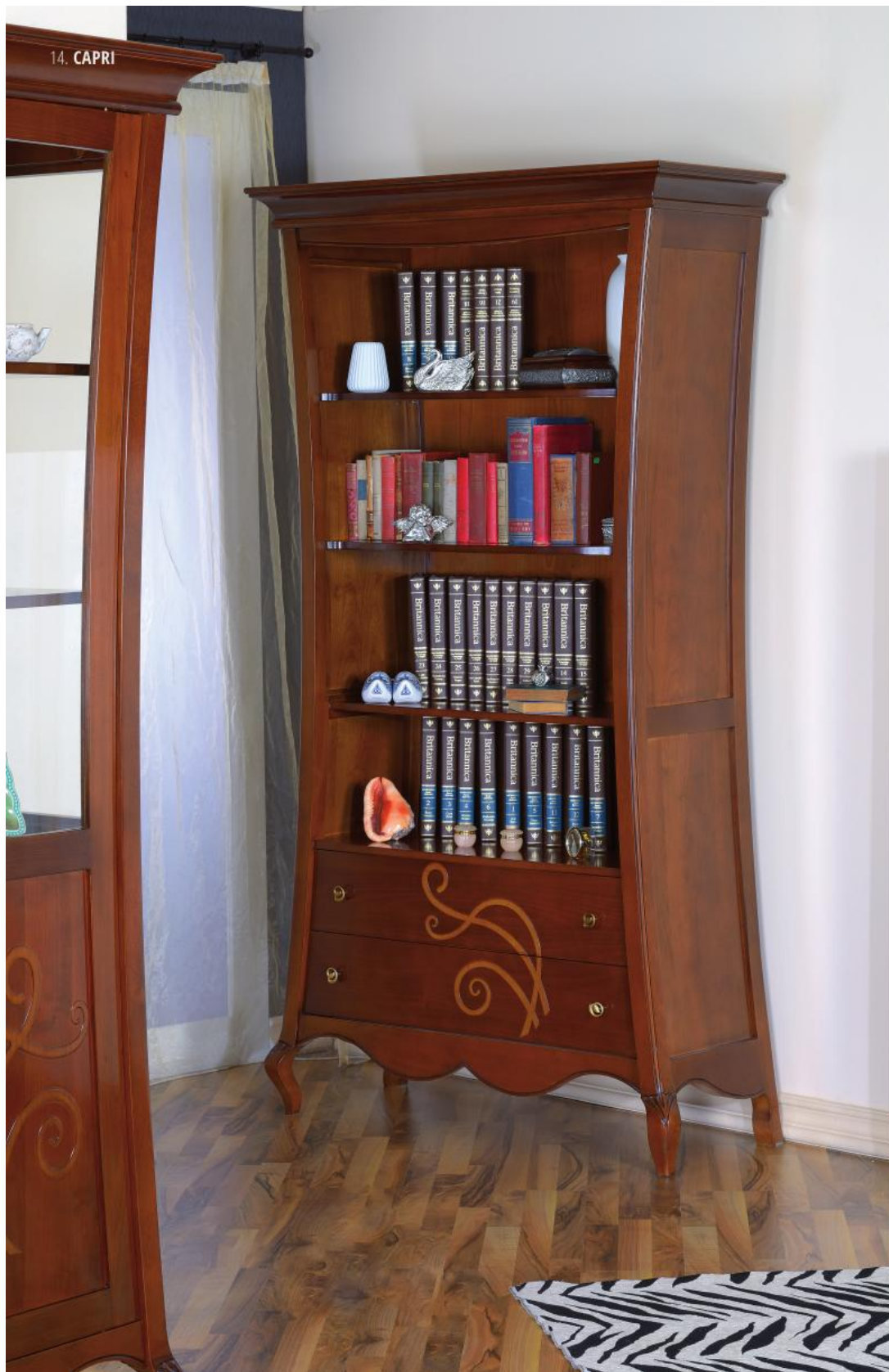
2 drawers bookcase Etoжерә 2 sertare Этажерка 2 ящ. мм 1156 500 2151 h