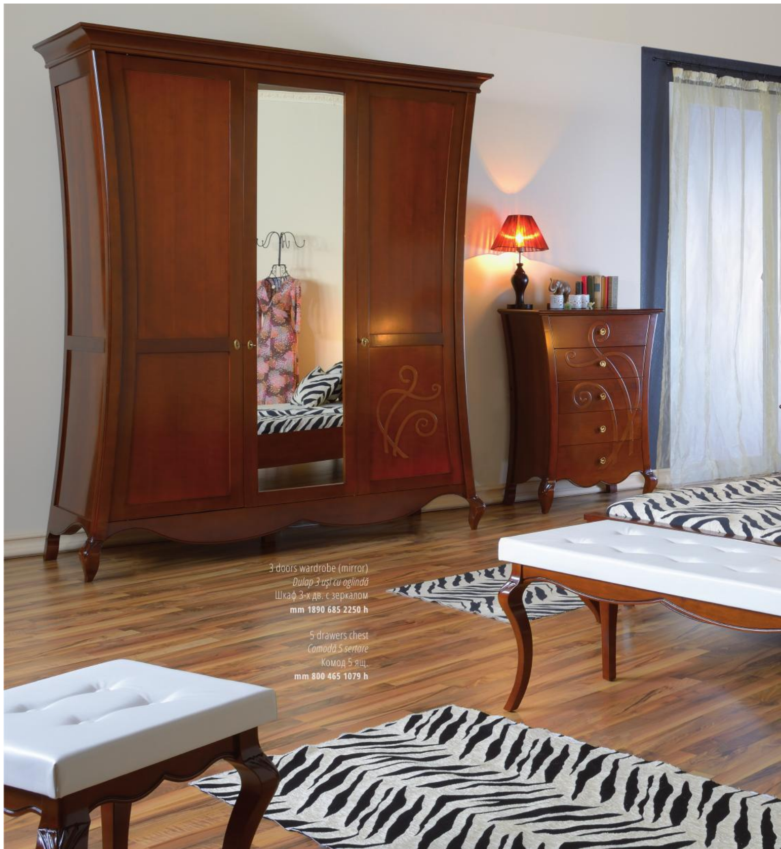
3 doors wardrobe (mirror) Dulap 3 uși cu oglindă Шкаф 3-х дв. с зеркалом mm 1890 685 2250 h