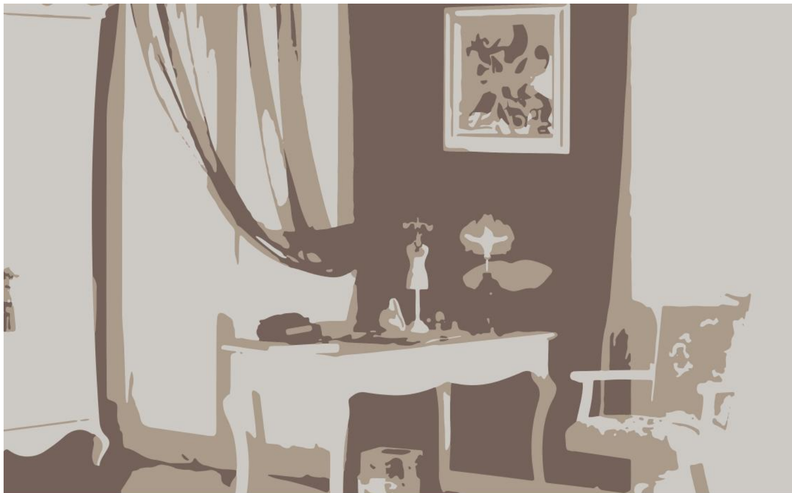
Young's room Cameră de tineret Молодёжная комната