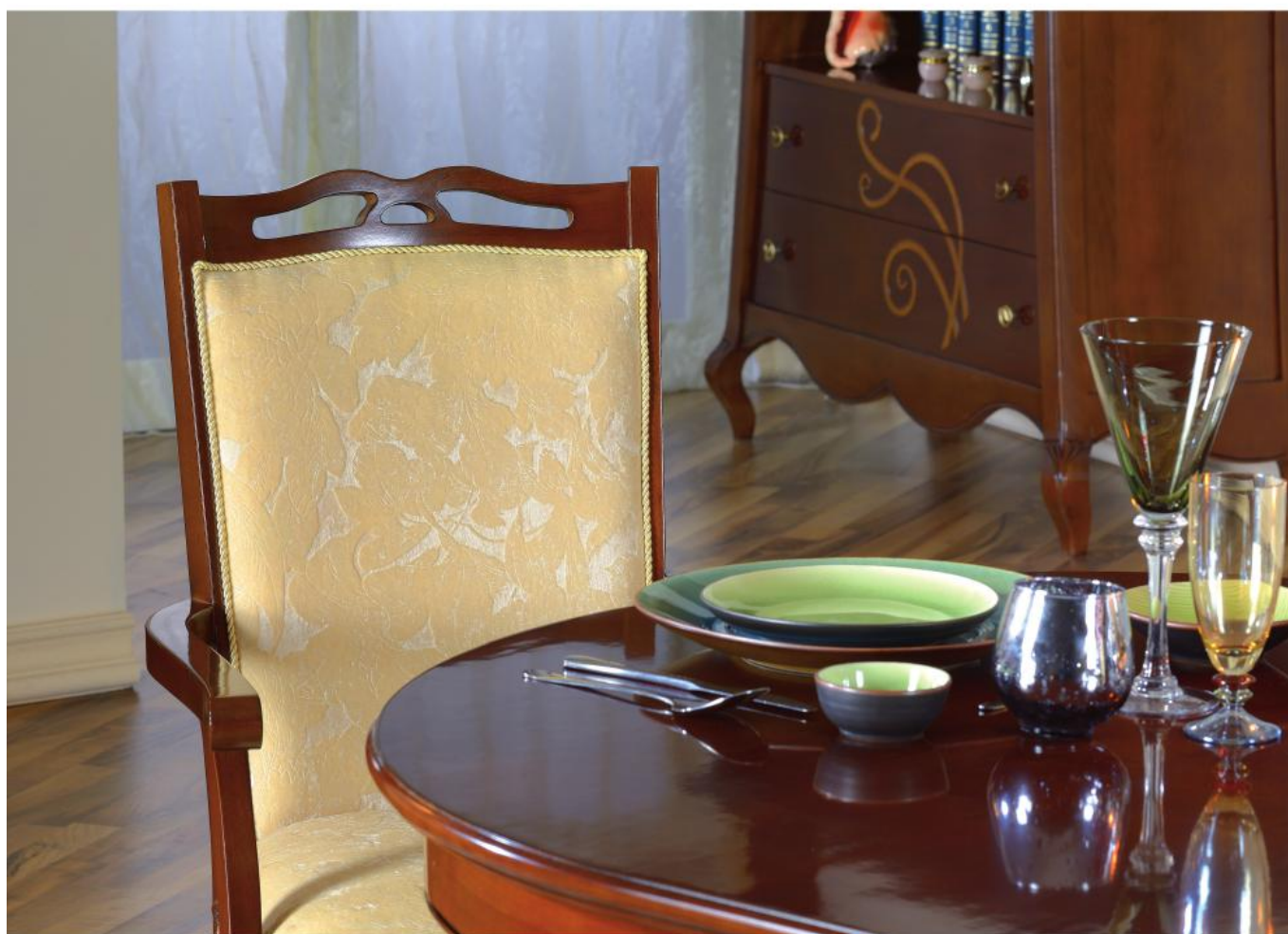
Armchair Scaun cu brațe Стул с подлокотниками mm 583 610 973 h