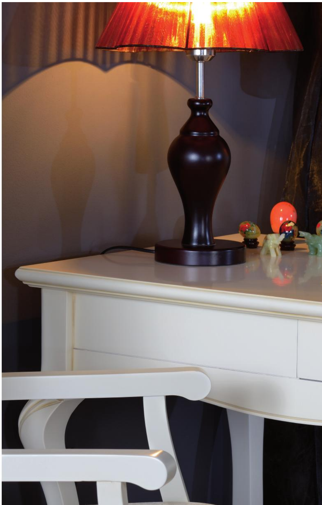
1 drawers desk Birou 1 sertar Письменный стол 1 ящ. mm 1303 603 790 h