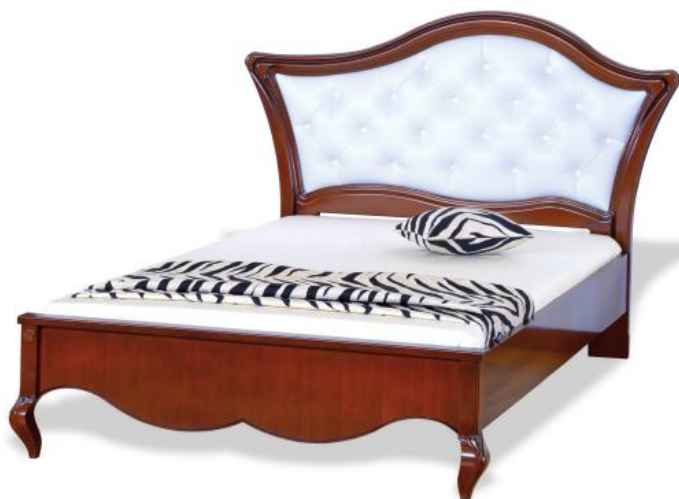
Bed 120 with upholstered headboard