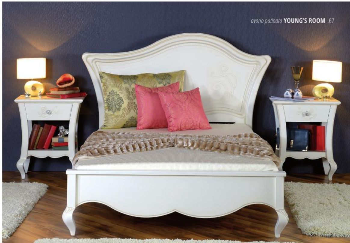
Bed 120 with patterned headboard Pat 120 tãblie cu ornament Кровать 120 деревянное изголовье с апликациями mm 1570 2120 1165 h