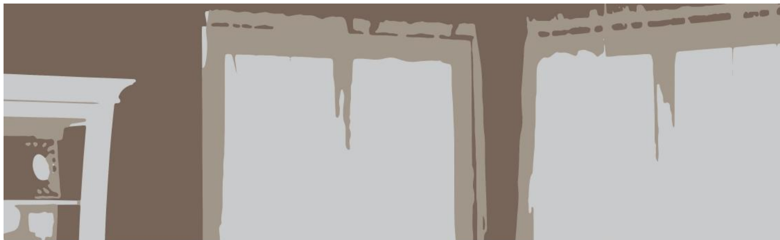
Living room Cameră de zi Гостиная