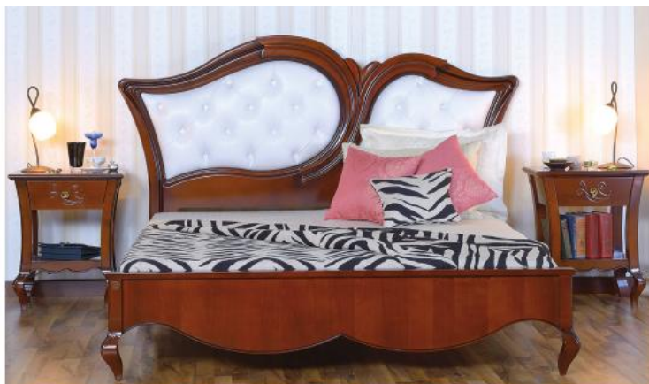
Bed 160/180 with upholstered headboard Pat 160/180 tapijat Кровать 160/180 обитое изголовье с пуговицами mm 1962/2180 2120 1285 h