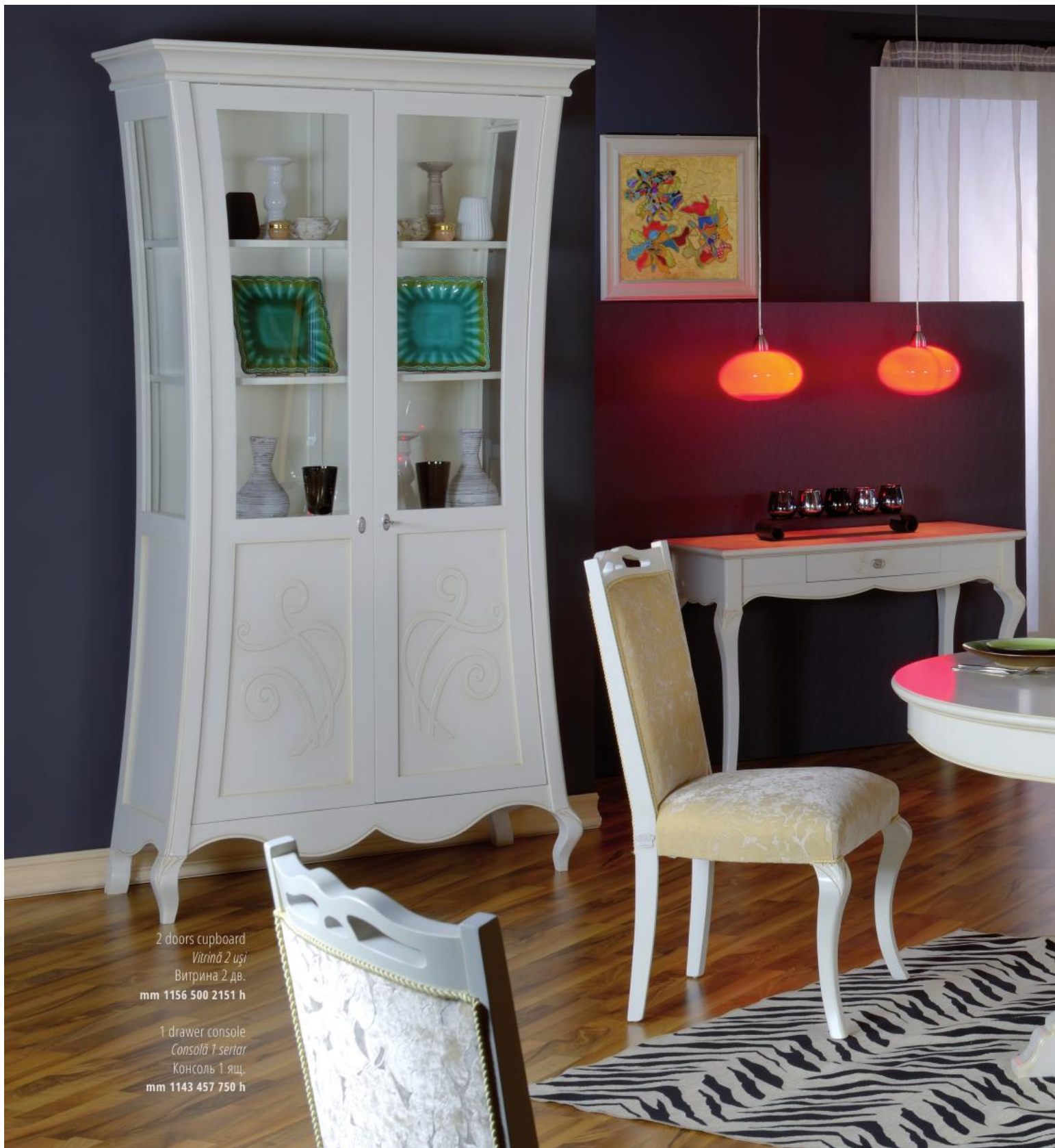
2 doors cupboard Vitrinā 2 uši Витрина 2 дв. mm 1156 500 2151 h