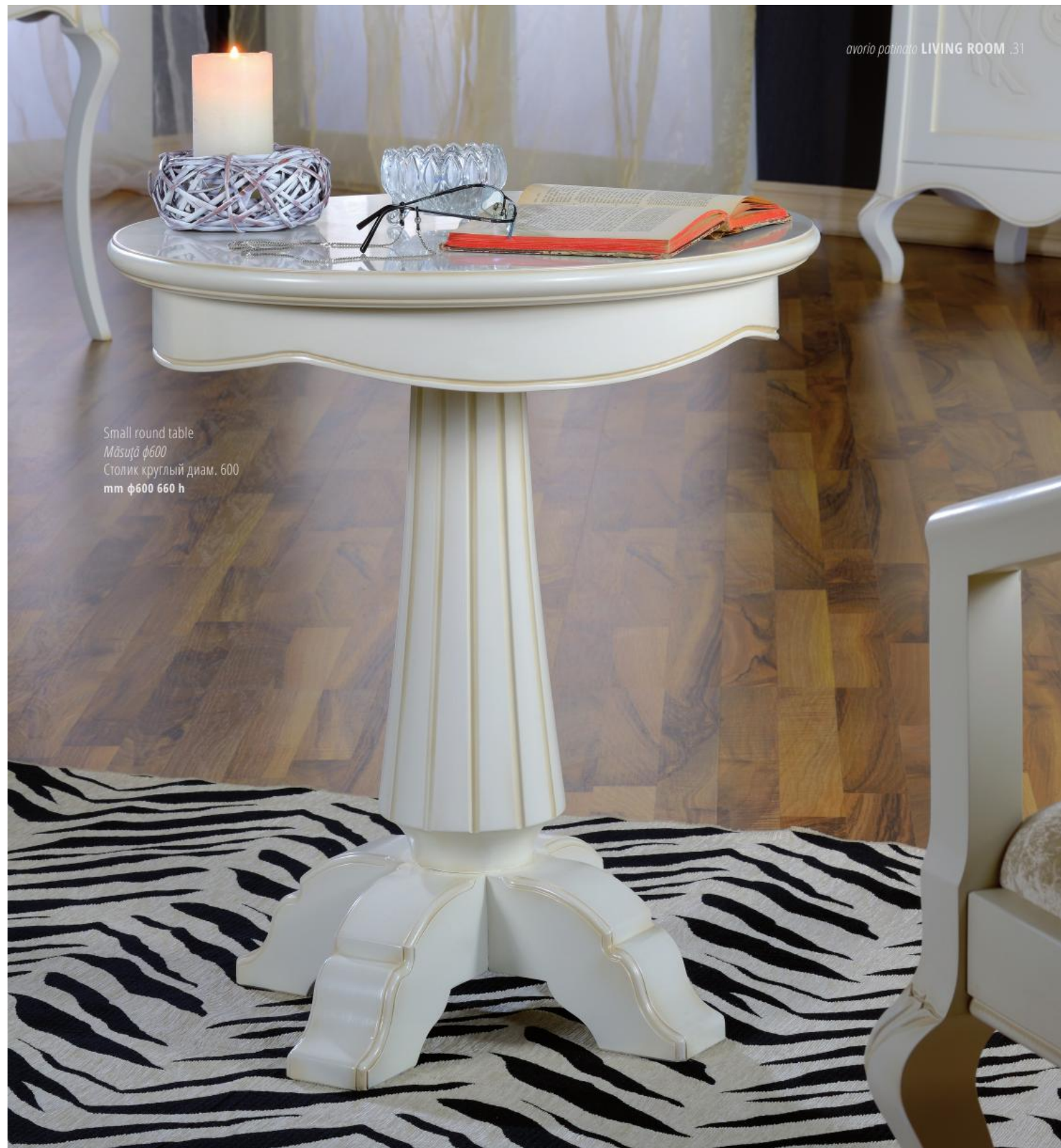
Small round table Māsuja φ600 Столик круглый диам. 600 mm φ600 660 h